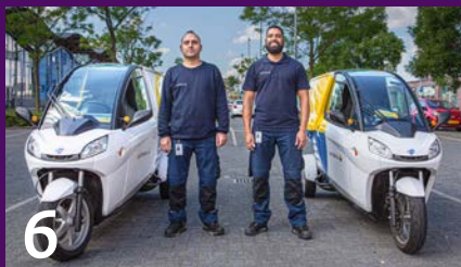
Hulpmonteurs voor één taak