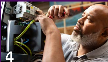
De kracht van de Beroepentuin