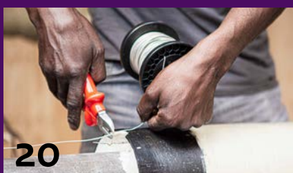
Leren in én na detentie