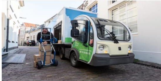
▲ Elektrisch goederenvervoer in de binnenstad van Zutphen.